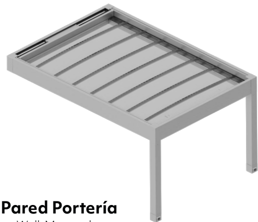
Pared Portería Wall-Mounted