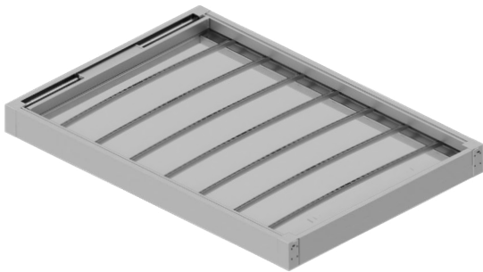
Entre Paredes Between Walls